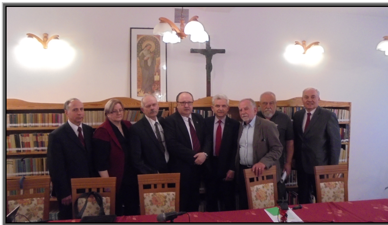
Posłowie i Senatorowie Sejmu Walnego oraz Król Polski Wojciech Edward I 25 kwietnia A.D.2018 Gdańsk Oliwa u ss. Brygidek

z IX Sesji Trzydniowego Sejmu Walnego Konstytucyjnego Pacyfikacyjnego podjęte dnia 25 kwietnia A.D. 2018 – Gdańsk Oliwa