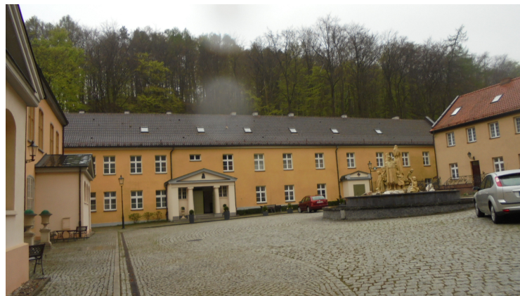
Ul. Polanki 124, Gdańsk Oliwa