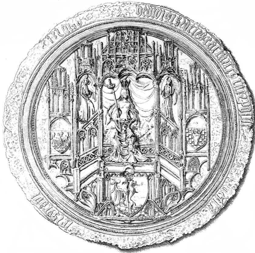
Pieczęć majestatyczna św. Jadwigi Króla Polski Wyrażny herb Wieniawa Ziemi Kaliskiej (Wielkopolskiej)