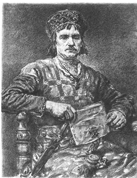
Bolesław V Wstydlivy (Cnotliwy, Roztropny)

Pierwsze Wici na XII NADZW. RADĘ SENATU – 17 czerwca A.D.2023 – Cedynia-Moryń - na Ziemi Pomorza Kaszubskiego Szczecińskiego