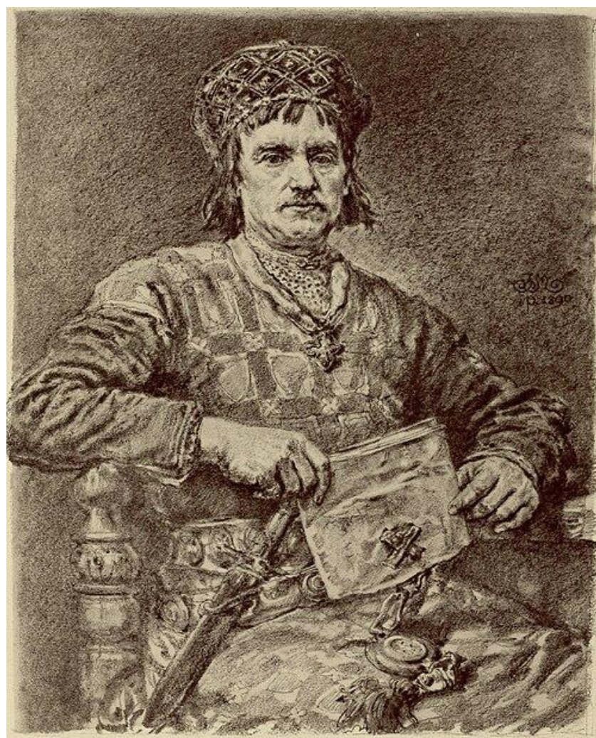
Bolesław V Roztropny (1226-1279)