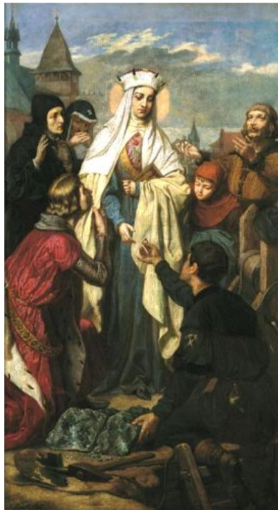
św. Kinga (1234-1292)